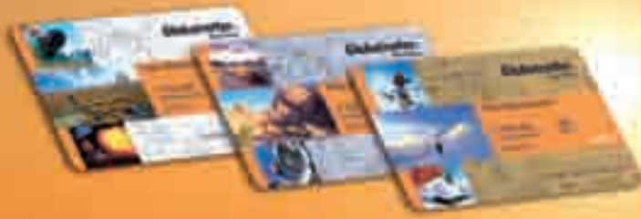
GlobetrotterCard Orange, Silber, Gold